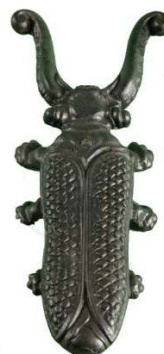
Slika 4: Rogač za sezuvanje