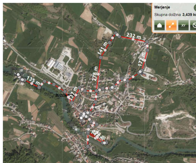
Slika 2: Potek poti