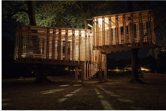
Slika 7: Hiška na drevesu