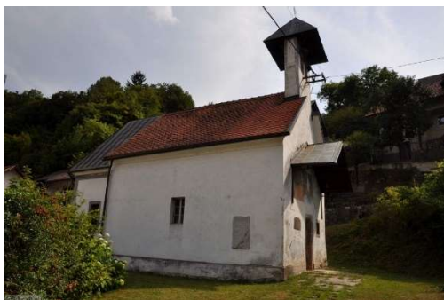
Slika 6: Cerkev sv. Nikolaja

V cerkvi sv. Roka, ki je bila posvečena po času kuge, so kasneje hodili romarji in prosili za zdravje oseb katere so zbolele za kugo ali gobavostjo, verjeli so, da romanje k njej da posebno moč in da ozdravi bolnega človeka.