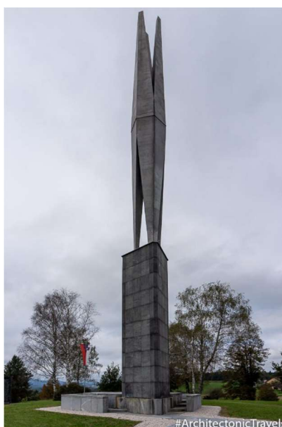
Slika 13: Spomenik NOB

Spomenik je posvečen 1140 padlim partizanom in aktivistom, kateri so izgubili svoje življenje na ozemlju Suhe krajine. Med njimi so tudi borci kar iz 17 tujih držav, ki so se borili proti okupatorju in svoja mlada življenja izgubila v Suhi krajini. Pod spomenikom se nahaja velika grobnica, v kateri so njihovi posmrtni ostanki padlih borcev iz tujine.