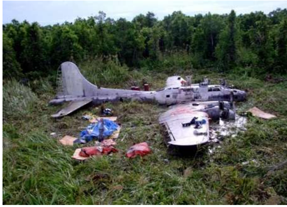
Slika 15: B-17 'Je Reviens'