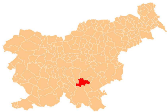
Slika 1: Lega Žužemberka

Kraj leži v Jugovzhodni Sloveniji na dolenskem. Prvič je bil pisno omenjen leta 1246, kjer se omenja grad. Tukaj v občini prebiva več kot 4800 prebivalcev, kateri se ukvarjajo tudi s kmetijstvom, mnogi pa z lesno obrtjo ali z polprevodniškimi elementi nekdanje tovarne keramičnih kondenzatorjev. Poleg tega pa imajo zelo aktivno turistično društvo katero se trudi Žužemberk oživeti ter ga predstaviti širši javnosti. Mesto je središče Suhe krajine, ime je dobilo zaradi železove rude oziroma zaradi šumenja reke, ki teče čez lehnjakove slapove. Suha krajina pa je zaradi velike količine apnenca v tleh kateri pa ne zadržuje vode in je območje malenkost bolj suho.