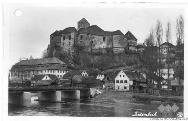
Slika 8: Grad pred obnovitvijo

Je tipična srednjeveška trdnjava. Grad stoji na pečini nad reko Krko katera je nudila zaščito pred napadi. Najbolj poznana lastnika sta bila Andrej Turjaški in knez Auersperg Janez Vajkard I. Kot večina mesta je bil tudi grad močno porušen med 2. svetovno vojno, saj je bil Žužemberk med vojno 22 krat bombardiran. Glede trdnjave pa lahko zasledimo veliko tragičnih zgodb in mitov. Ne smemo pa pozabiti na hude ječe, ki so bile v gradu, a so bile kmalu zaprte, ko se je iz gradu izselilo okrajno sodišče. Še dandanes si lahko ogledamo to mogočno trdnjavo, v času poletnih dni pa si lahko ogledate Trške dneve na katerih lahko vidite razne srednjeveške plesе, mečevanje, lokostrelstvo ali pa se popeljete s kočijo po Žužemberku.