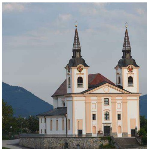
Slika 12: Cerkev sv. Mohorja in Fortunata