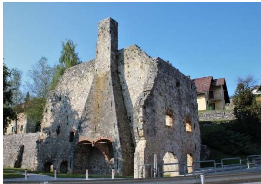
Slika 3: Plavž na Dvoru

Turjačani so na dvoru leta 1796 postavili plavž v katerem so talili železovo rudo, kasneje so postali še livarna in železo so ulivali v kalupe. Tam so poleg različnih naprav za industrijo in gradbeništvo izdelovali tudi predmete umetniškega liva, kot so svečniki, okrasni krožniki, grbi, peči, nagrobni križi, vodnjaki in tudi mostovi. Ker pa so imeli prehudo konkurencijo so z letom 1891 prenehali z obratovanjem. Produkti te železarne so zakročili tudi v Benetke kjer imajo še dandanes postavljene litoželezne svetilke na Markotovem trgu.