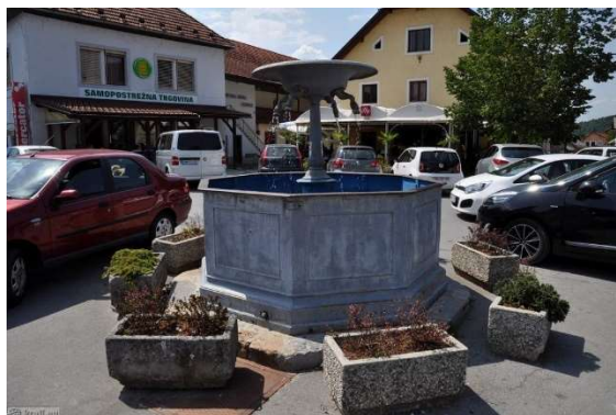
Slika 9: Litoželezen vodnjak

Je eden izmed izdelkov dvorske železarne. Postavljen je na sredo trga in je bil nekoč kot javni vodovod. V bližini je mesto, kjer je prej stala mogočna lipa, katera pa je bila posajena v spomin na tragično preminulo ženo Ivana Turjaškega. Kajti Ano je v grajskem parku raztrgala udomačena medvedka.