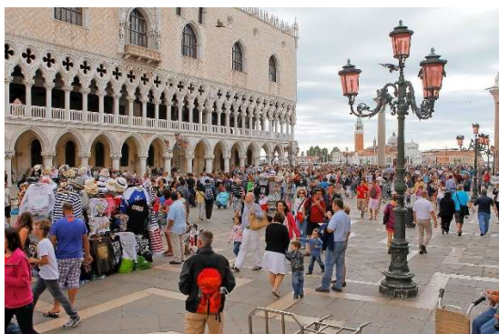
Slika 5: Litoželezna svetilka v Benetkah