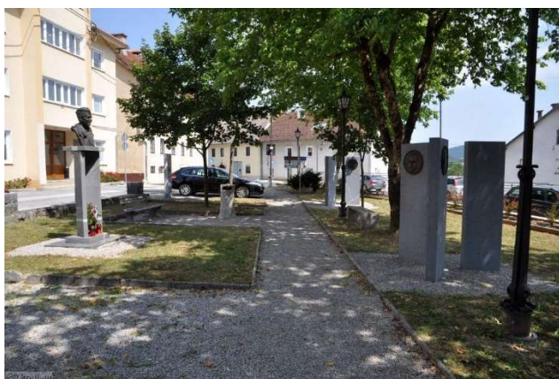
Slika 11: Park znanih suhokranjcev